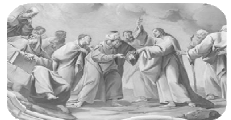
Jesus und der Zinsgroschen, Fresko (1744) von Paul Troger, Stiftsbibliothek Altenburg (NO)