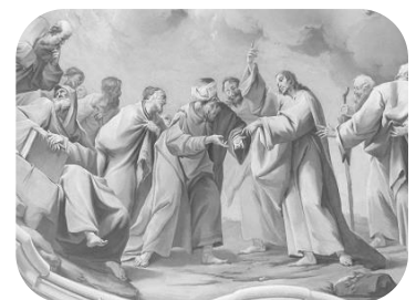
Jesus und der Zinsgroschen, Fresko (1744) von Paul Troger, Stiftsbibliothek Altenburg (NÖ)