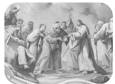
Jesus und der Zinsgroschen, Fresko (1744) von Paul Troger, Stiftsbibliothek Altenburg (NÖ)