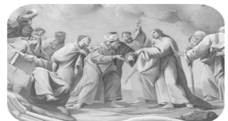
Jesus und der Zinsgroschen, Fresko (1744) von Paul Troger, Stiftsbibliothek Altenburg (NO)