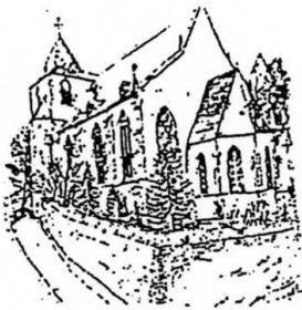
St. Philippus u. Jakobus

vom 23. September 2023 bis 12. November 2023