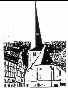
St. Johann Baptist