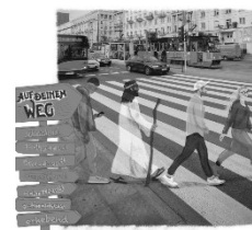
(Jugendkreuzweg 2025)

Der Ökumenische Jugendkreuzweg 2025 „Auf deinem Weg“ bietet die Möglichkeit, in der Gemeinschaft mit anderen über diese Fragen nachzudenken und Antworten zu finden.