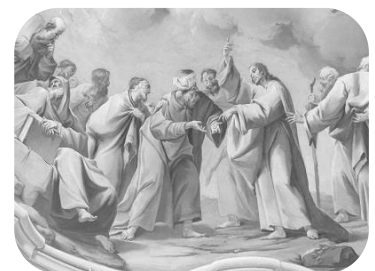
Jesus und der Zinsgroschen, Fresko (1744) von Paul Troger, Stiftsbibliothek Altenburg (NÖ)